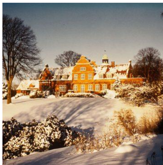
Foto år 1980 før ombygningen

Sauntehus.slotshotel.dk Tlf. 49750315 sauntehus@slotshotel.dk